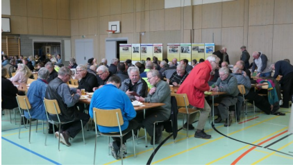
Die Turnhalle mit Besuchern und Helfern