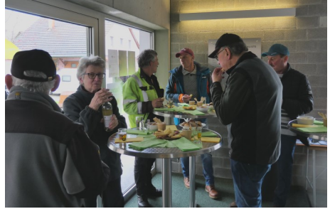
Apéro mit dem Gemeinderat

Um 15:00 trat die Spitze unserer Fahrzeugkolonne die Rückfahrt nach Neuhausen an, und um 19:00 standen die Fahrzeuge wieder an ihrem ange-