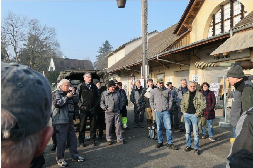
Begrüssung durch den Vereinspräsidenten

Es ist ein unspektakulärer Tag; es zeigt sich, wie gut alles eingespielt ist. Deshalb kann dieser Bericht relativ kurz ausfallen.