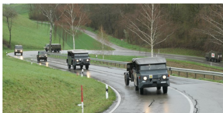
Saurer 4 MH, Häfi und Pinzen