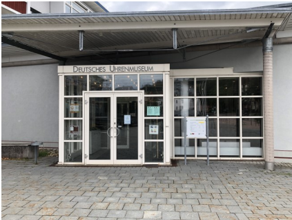
Deutsches Uhrenmuseum Furtwangen