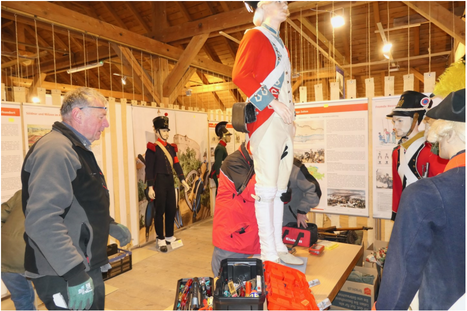
Neugestaltung der Ausstellung „farbenfroh, feldgrau, getarnt“

gefallen ist! Im Innern dominiert der Kampf gegen den Staub. Auch die Reinigung der vielen Vitrinen ist jedes Jahr eine Heidenarbeit.