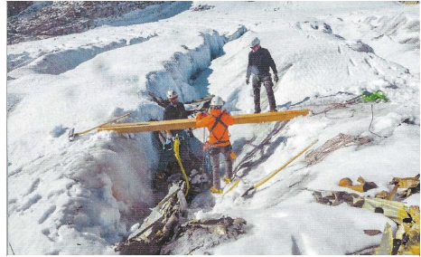
Der letzte der beiden Motoren der Douglas C-53 wird in einer Gletscherspalte freigelegt

- Fotoreport Markus Rieder aus SkyNews.ch Dezember 2022