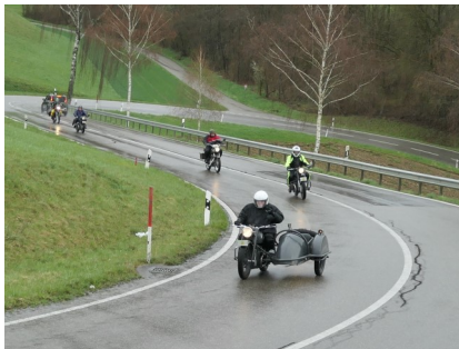
Motorräder an der Spitze