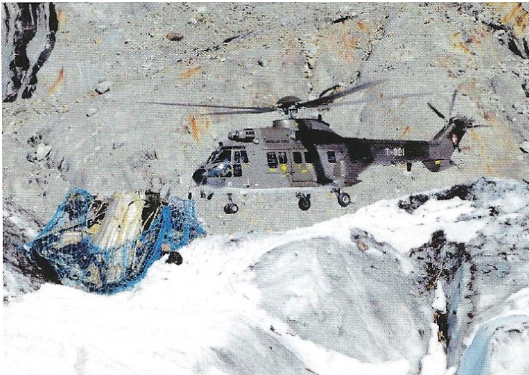
Das Lastennetz ist bereit für den Flug ins Tal.