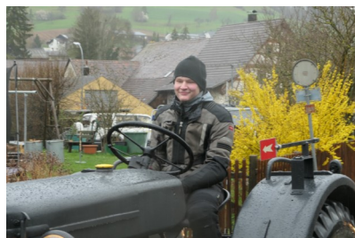
Irenes Sohn mit dem Bührer