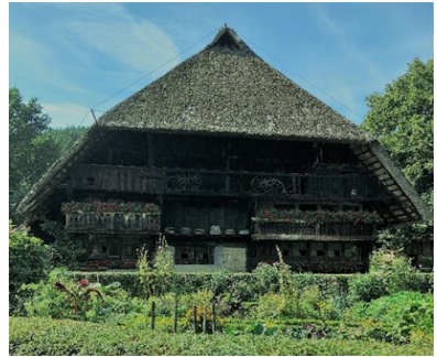
Schwarzwälder Freilichtmuseum Vogtsbauernhof