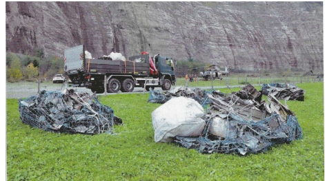
Vom Urbachtal erfolgte der Abtransport der Trümmerteile mit Lastwagen auf den Militärflugplatz Meiringen.