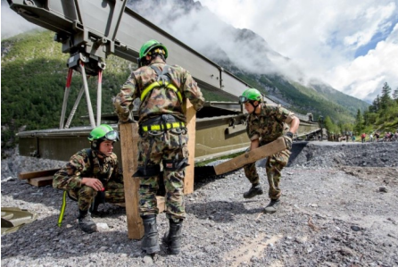
Unterstützungsbrücke 46m des Katastrophenhilfe Bereitschaftsbataillons

logiebedingten Katastrophen im In- und grenznahen Ausland eingesetzt (Beispiel Bergsturz von Bondo 2017). Mittels Pikettdienst stellt das Bataillon während des ganzen Jahres die militärische Katastrophenhilfe sicher und ist innert weniger Stunden einsatzbereit.