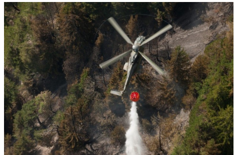
Helikopter der Luftwaffe bei der Bekämpfung von Waldbränden

Die Luftwaffe wird am Museumstag vom 1. Juli 2023 mit einem Helikopter und einer Ausstellung über ihre vielfältigen Mittel und Einsätze präsent sein.