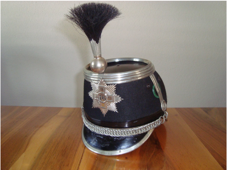
Käppi eines Schaffhauser Dragoners, Schwadron 16, von 1883 bis 1925