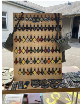
Uniformabzeichen im Museumsshop