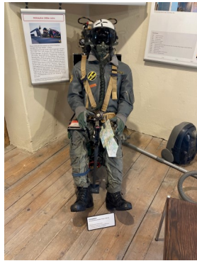
Hunter-Pilot im Schleudersitz