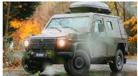
Ein «Radiometrie Land Fahrzeug» des ABC-Bereitschaftsdetachements 104/204

Am Museumstag vom 1. Juli 2023 wird das ABC-Bereitschaftsdetachement 104/204 mit einem «Radiometrie Land Fahrzeug» und einem Roboter für ferngesteuerte