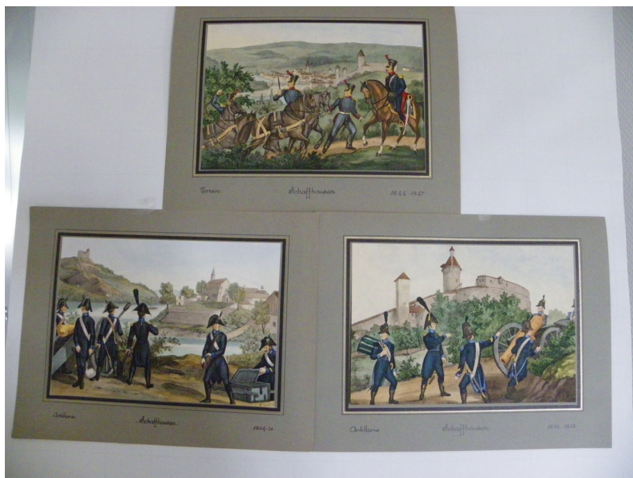
Gravures Militaires Kanton Schaffhausen , A. von Escher