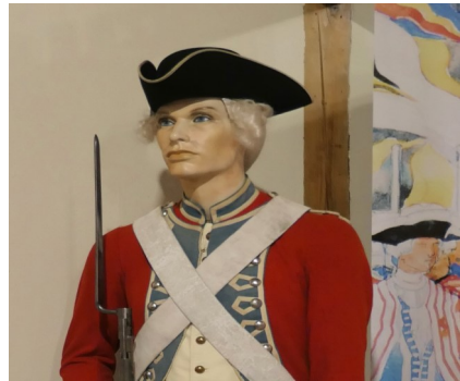
Füsilier des CH Gardegegment 1780

deren Puppen je nachdem verkleinern, d. h. zersägen und wieder zusammensetzen, anziehen und in die richtige Haltung bringen. Das ist meist äusserst mühsam (ich weiss, wovon ich rede). Ich möchte nicht unerwähnt lassen, dass die Puppen verblüffend lebendig und individuell wirken. Dies ist vor allem dem Maler Erwin Gloor und neuerdings Daniela Thurnherr zu verdanken, welche die Gesichter liebevoll gestaltet haben.