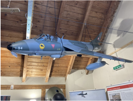
Flugfähiges Modell Kampffjet Hunter

Die aufgewertete Ausstellung hat zweifellos an Attraktivität gewonnen. Die Arbeiten aller Beteiligten dafür waren enorm. Der Aufwand hat sich allerdings gelohnt, wie die ersten Reaktionen der Besucher zeigen!