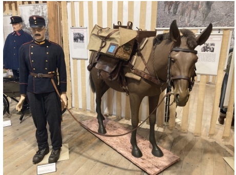
Maultier mit Bastsattel