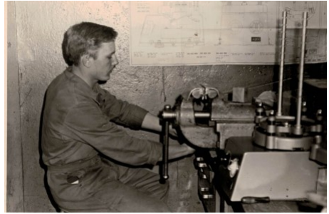
Zweites Lehrjahr: Bei der Montage von Sandprüfapparaten

In den Jahren 1967 bis 1971 absolvierte er eine Lehre als Maschinen Schlosser bei Georg Fischer . In dieser Lehre konnte er alle damaligen Abtei-