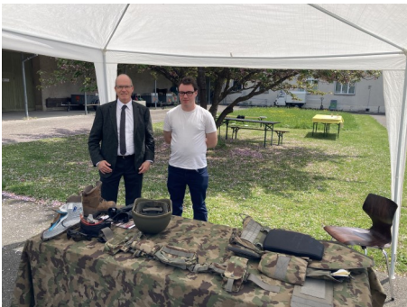
Neue persönliche Ausrüstung