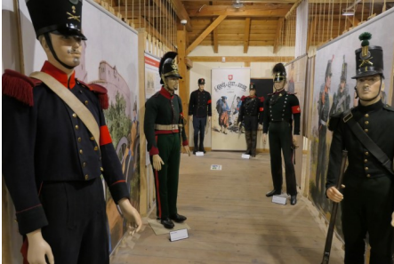
Vielfalt bei den Kopfbedeckungen

Die klarere Struktur fällt z. B. bei der Gruppe von dunkelblau und dunkelgrün gekleideten Soldaten aus dem mittleren 19. Jh. auf. An ihren Tschakos