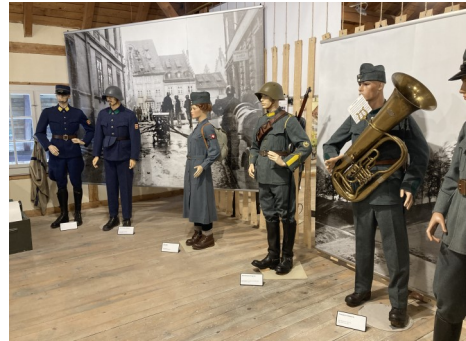
Teil der neugestalteten Ausstellung