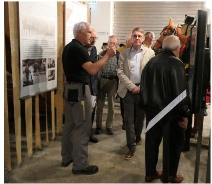
Führung in der Artillerie-Ausstellung

Einmal im Monat übernimmt er die Aufsicht im Museum am Rheinfluss.