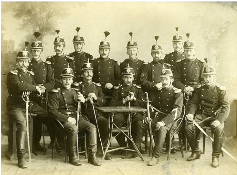
Dragoner der Schwadron 16 um 1900, mit Wachtmeister (2. von rechts sitzend) und Hufschmied (3. von rechts stehend)

Uniformen und Kopfbedeckungen von Schaffhauser Kavalleristen können im Museum im Zeughaus Schaffhausen besichtigt werden.