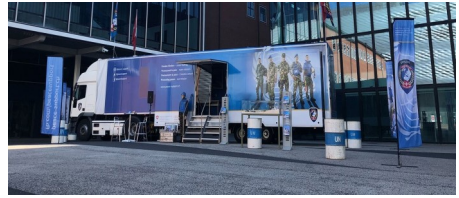
Das multimediale Infomobil «Roadshow» von SWISSINT

SWISSINT wird am Museumstag vom 1. Juli 2023 mit der sogenannten «Roadshow» teilnehmen.