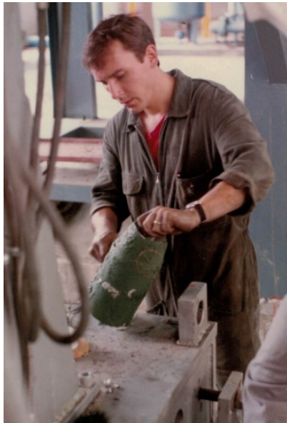
In Taiwan bei der Komplettierung eines Warmhalteofens für Kupferlegierungen

tätig sein zu können, so in Rumänien, Ägypten und Korea. Es folgte eine weitere Stelle bei Landert Motoren in Bülach . Dort leitete er das Projekt Alarmsirenen, mit dem der Zivilschutz die Firma beauftragt hatte.