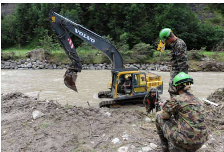
Das Katastrophenhilfe Bereitschaftsbataillon im Einsatz