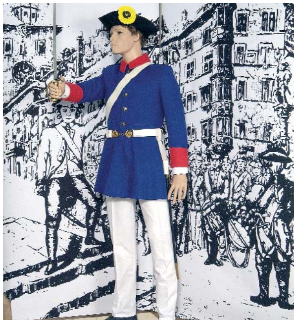
Die Gründungszeit des Kadettenkorps Schaffhausen 1791

Die Ausstellung befindet sich im Obergeschoss des Museums im Zeughaus.